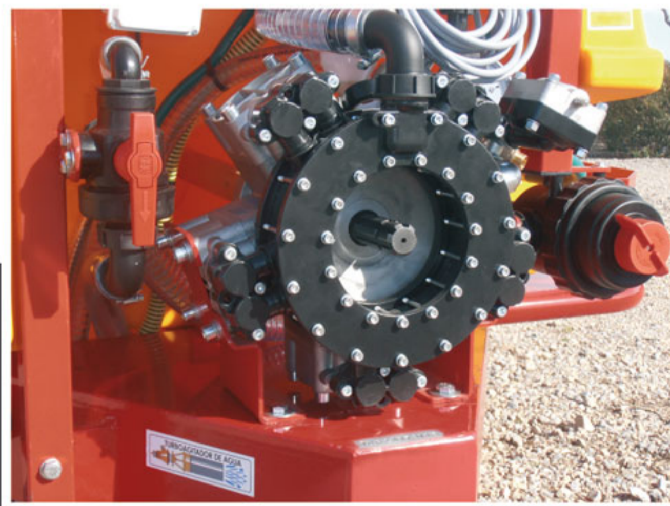
BOMBA ZENYZ DE 120, 150 Y 180 lts/min